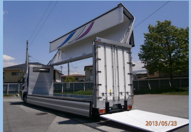
10t空調エアサスウイング車(オーバートーンウイング・上部開放9:1)