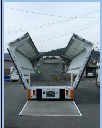
10t空調エアサスウイング車(ダブルウイング・オープントップ)