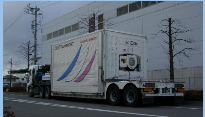
空調コンテナトレーラ No.2 (片側ウイング式開閉コンテナ)