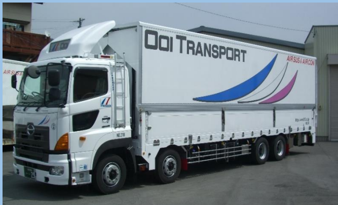
10t空調エアサスウイング車・2.5tパワーゲート付(ダブルウイング)