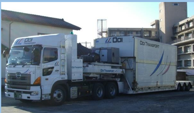
空調コンテナトレーラ No.1 (Wコンテナ・上部開放タイプ)