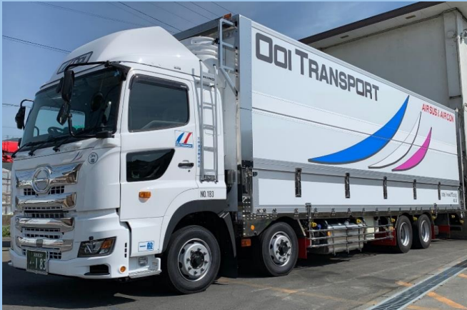
10t空調エアサスウイング車・2.5tパワーゲート付(オーバートーンウイング)